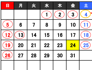
2025 1 January